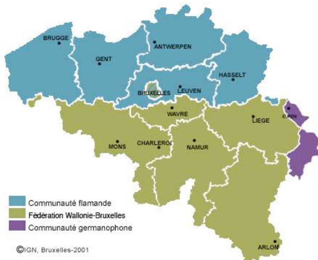
Figure 1 : Carte géographique des communautés linguistiques en Belgique

Les domaines de la violence conjugale et des réalités LGBT relèvent principalement du palier politique communautaire. De fait, les associations francophones oeuvrant dans ces deux champs d'activités reçoivent des subsides (subventions) principalement d'un ministère ou d'une agence de la Communauté française et, dans une moindre mesure, de la Région wallonne. La Belgique francophone partage plusieurs similitudes avec le Québec, tant sur le plan des lois